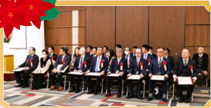
寄付者の皆様、お力添えいただき、心より感謝申し上げます