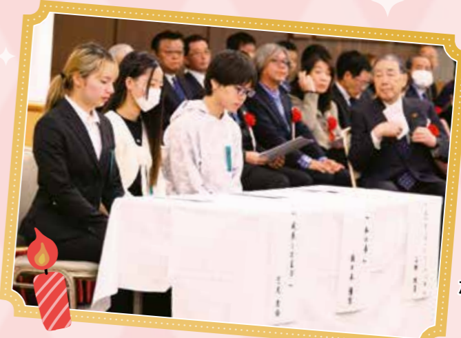
作文発表、 ありがとうございました！