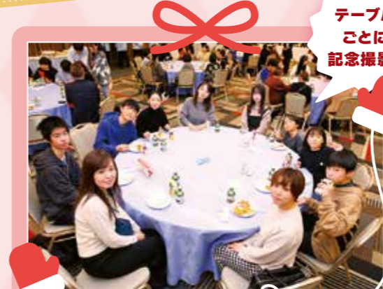
テーブルごとに記念撮影!