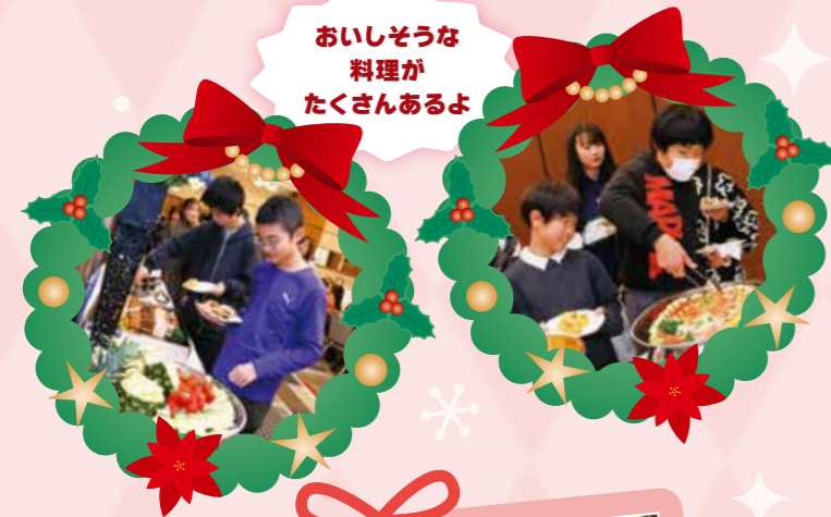
おいそうな料理がたくさんあるよ