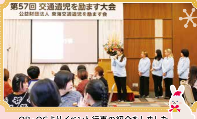
OB・OGよりイベント行事の紹介をしました