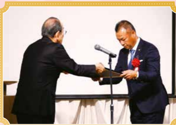
ご支援いただきありがとうございます