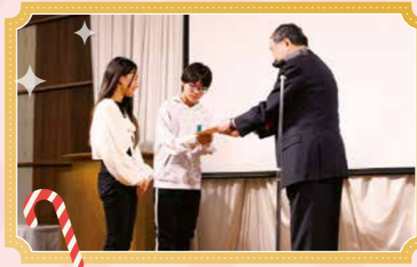
中部善意銀行様より 子ども達に記念品を頂戴いたしました。 ありがとうございます。