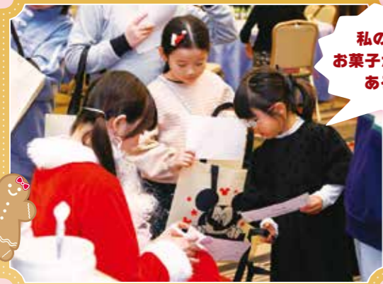
私のスキなお菓子がいっぱいあるな～