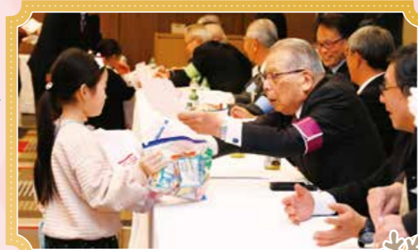
ゴールまであと少し、役員さんありがとう