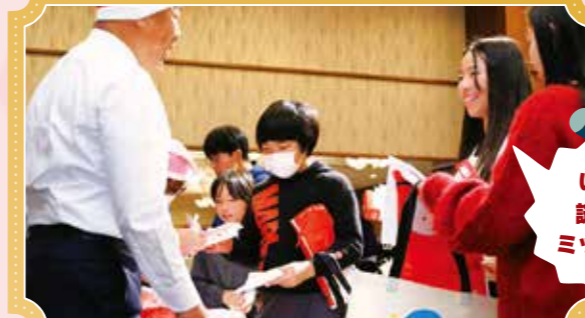
いざ！謎解きミッション