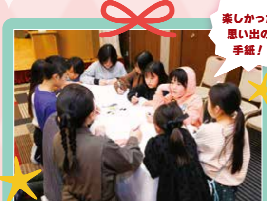
楽しかった思い出の手紙!